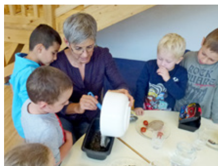
Im Kindergartenalltag wird viel Wert auf gesunde Ernährung und genügend Bewegung gelegt

Bereits im Kleinkind- und Kindergartenalter soll der Grundstein für eine bewusste Ernährung und gesunde Lebensweise gelegt werden und deshalb steht der Kindergarten schon seit vielen Jahren hinter diesem Konzept!