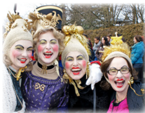
Lustiges Treiben beim Faschingszug