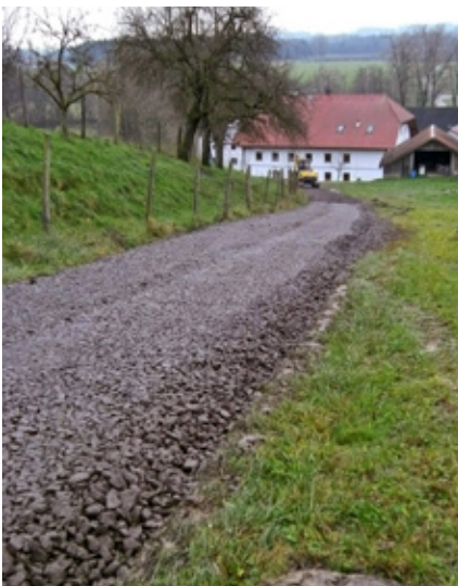
Der instandgesetzte Wirtschaftsweg Hofing

Auf einer Länge von rund 250 m wurde ein Wirtschaftsweg in Hofing instandgesetzt. Er führt ausgehend von der Liegenschaft Ettl Richtung Hochpireth und wies bereits tiefe, ausgeschwemmte Fahrspuren auf. Durch die Aufbringung von Granitrecyclingmaterial hat der Weg nun wieder eine dauerhafte Stabilität erhalten. Die geschätzten Kosten betragen 6.000,00 €. Davon werden vom Land Oberösterreich und den Interessenten jeweils 25 % getragen. Die restlichen 50 % werden aus Gemeindemitteln beigesteuert.