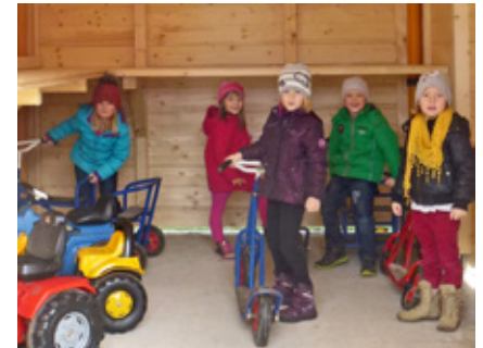
Nun können die Kindergartenkinder ihre Fahrzeuge in der neuen Garage abstellen