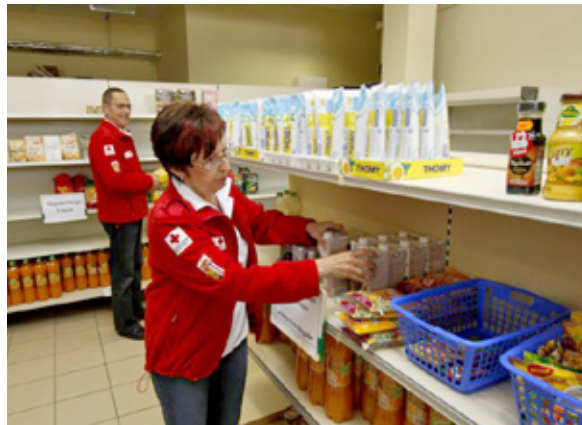
Im Sozialmarkt in Schärding können alle Personen mit einer Einkaufskarte einkaufen

Die Frage, ob man sich noch etwas zu essen leisten kann, sollte sich im Bezirk Schärding keiner stellen: Deshalb bietet das Rote Kreuz Schärding nun im Sozialmarkt Waren des täglichen Bedarfs für wenig Geld an. Unter dem Motto „Verteilen statt vernichten“ werden Waren angeboten, die aus den Supermärkten raus müssen: Produkte mit kleinen Verpackungsschäden, aus Überproduktionen oder mit kurzem Ablaufdatum, solange sie noch völlig intakt sind. Diese werden von den freiwilligen Mitarbeitern aufbereitet und für einen symbolischen Preis an Menschen mit geringem Einkommen verkauft.