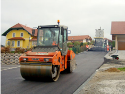
1.800 m 2 Asphalt wurden von der Firma Swietelsky am Würmerfeld eingebaut

Baugrundstücke wurde nun heuer das letzte Teilstück der Siedlungsstraße Würmerfeld asphaltiert.