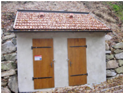
Das neue WC in der Kellergröppe wurde so gestaltet, dass es wie ein Keller aussieht

Aus der Bevölkerung hört man viele „Geschichten und Meinungen“ zum Thema Ausbau der Kellergröppe. Nun ein paar aufklärende Worte dazu. Aufgrund der steigenden Besucheranzahl war die Notwendigkeit