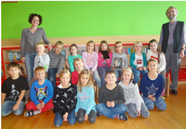
Die Leseratten der Volksschule freuten sich sehr über das Tolino Tablet

wurde. Nun steht dem Schmökern mit einem neuen Medium nichts mehr im Weg.