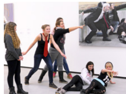
Die Schüler begegneten der Kunst auf eine etwas andere, jedoch sehr interessante, Art und Weise

Nach der vorjährigen Exkursion ins Landesmuseum Linz war dies die zweite Begegnung mit Kunst und wiederum war das Echo sehr positiv – eine gelungene Veranstaltung also!