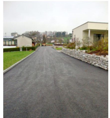
Das fertige Straßenstück Richtung Norden

Viele der Vorarbeiten wie die Herstellung einer ordnungsgemäßen Entwässerung oder das Anpassen der Kanalschächte und Wasserschieber an die neuen Höhen erfolgten durch den Gemeindebauhof. Das Setzen von ca. 275 m Randleisten und die Asphaltierung wurden von der Fa. Swietelsky, Taufkirchen/Pram, durchgeführt. Die Gesamtkosten belaufen sich auf ca. 63.000,00 €.