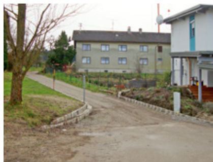
Das neu errichtete Straßenstück in Brünning

Zur Aufschließung eines neu gewidmeten Baugrundstückes in Brünning war es erforderlich, ca. 40 m Kanal neu zu errichten und rund 80 m eines bereits vorhandenen öffentlichen Gutes auszubauen und zu entwässern.