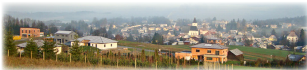
Die Bebauung am Ahornweg geht voran. Zwei der Wohnhäuser sind bereits bewohnt