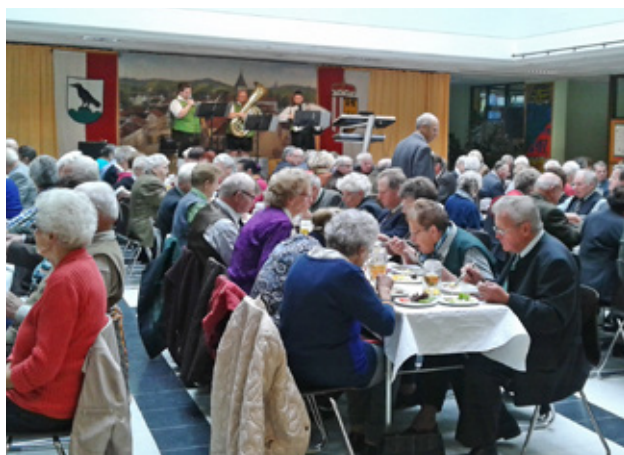
Für gute Unterhaltung und das leibliche Wohl war am Tag der Senioren bestens gesorgt

170 Personen folgten der Einladung zu einer gemeinsamen Feier mit Mittagessen. Für die musikalische Umrahmung sorgten die „Grafin Spitzbuam“ aus Freinberg. Sie unterhielten das Publikum mit Schlagern, gut bekannten Volksliedern und der ein oder anderen „Weisheit“ über das Leben.