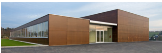
Durch das Gründerzentrum sollen Jungunternehmen gefördert werden

Seit 2006 wurden von den im Gründerzentrum eingemieteten Betrieben bereits mehr als 57.000,00 € an Kommunalsteuer geleistet, wobei diese seit 1. Jänner 2010 bis zum Erreichen eines Betrages von 50.000,00 € wieder an das Gründerzentrum zurückgeführt wird. Ziel des Gründerzentrums ist es, Jungunternehmern durch die Zurverfügungstellung von günstigen Mietflächen einen guten Start in die Selbstständigkeit zu ermöglichen.