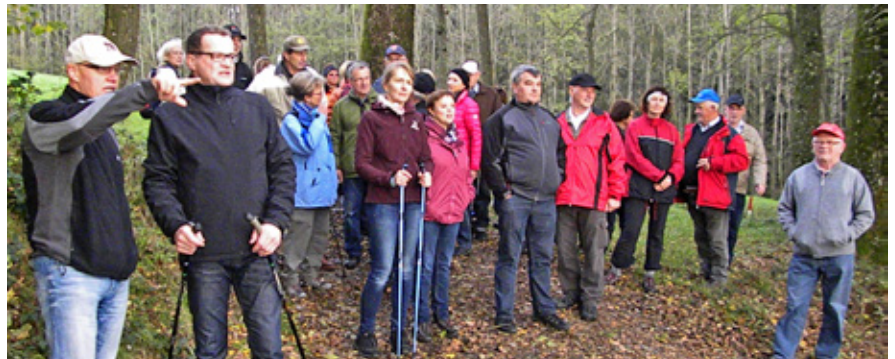
Gemeinsam wurden die nördlichen Grenzen des Raaber Gemeindegebietes erkundet

Gemeinde in Kooperation mit dem ÖAAB organisiert. Bei schönem Herbstwetter konnten 40 Teilnehmer einen wunderbaren Ausblick am Rotmayrberg – dem höchsten Punkt von Raab – genießen. Am 15. März 2015 soll die Grenzwanderung im Westen des Gemeindegebietes fortgesetzt werden.