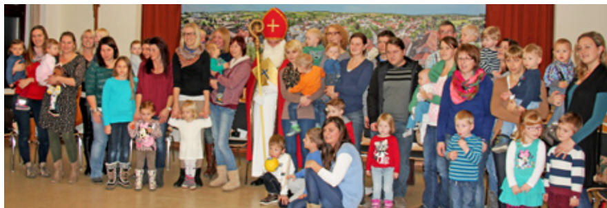
Der Nikolaus besuchte die Spielgruppe und überbrachte jedem Kind ein Geschenk

Nach den Weihnachtsferien geht's im Jänner wieder mit der Spielgruppe weiter. Wir freuen uns auch auf neue Spielkameraden! Spielgruppenleiterinnen werden dringend gesucht!