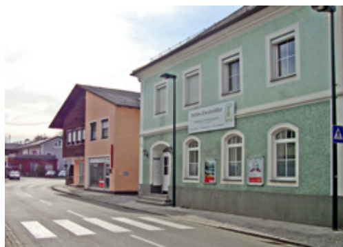
Ein Schutzweg samt Beleuchtung konnte in der Hauptstraße errichtet werden