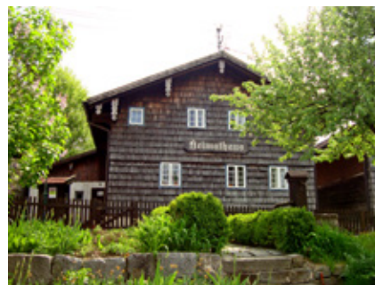
Seit zwanzig Jahren wird im Heimathaus die Vergangenheit von Raab gezeigt

Eröffnung der neuen Sonderausstellung im Heimathaus ist am Sonntag, 3. Mai um 14:00 Uhr.