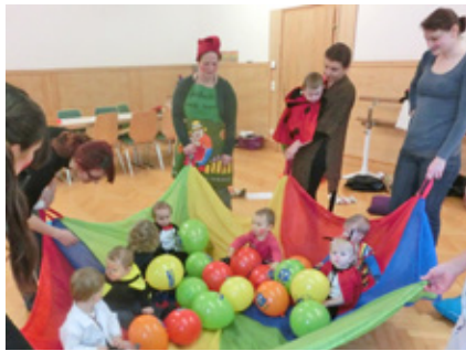
Mit bunten Luftballons wurde der Fasching in der Spielgruppe gefeiert