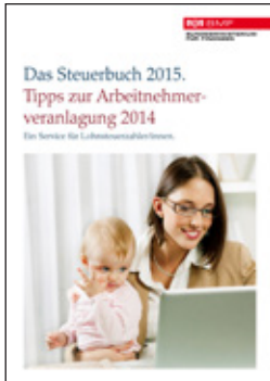
Im jährlich erscheinenden Steuerbuch sind häufige Steuerfragen erklärt

ämtern auf; kann aber auch auf der Homepage des Bundesministeriums für Finanzen als e-Book gelesen und gratis heruntergeladen sowie als Publikation bestellt werden.