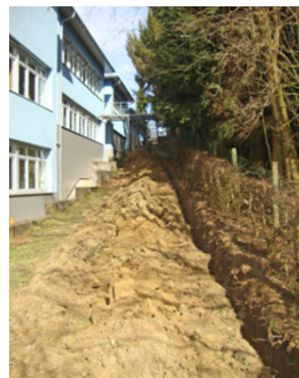
Entlang der Neuen Mittelschule waren Aufgrabungsarbeiten zur Verlegung des Glasfaserkabels nötig