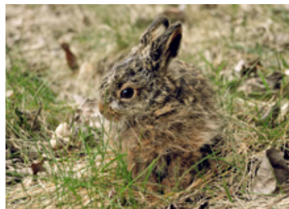
Die Bewohner von Wald und Wiesen dürfen besonders im Frühling nicht gestört werden!

gessen schon einmal ihre guten Manieren, wenn ihr Jagdinstinkt geweckt wird.