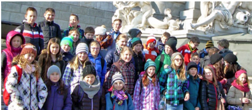
Zur Erinnerung an den Tag in Wien wurde vor dem Parlament ein Gruppenfoto geschossen

Von den Logen und der Galerie aus konnten die Schüler das Ambiente des Staatsoperengebäudes genießen, den Darbietungen der Wiener Symphoniker und der Geschichte des Papageno folgen. Tosender Beifall am Ende der Aufführung zeigte von der Begeisterung der Schüler. Diese außergewöhnliche Schulveranstaltung und insgesamt ein toller Tag in der Bundeshauptstadt Wien werden den Schülern bestimmt noch lange in Erinnerung bleiben!