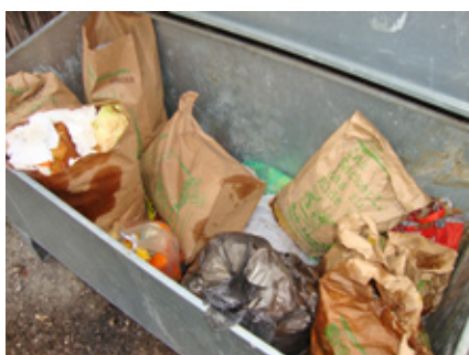
Nicht nur am Kommuneplatz gibt es Probleme mit der Bioabfall-Sammlung: Plastiksackerl gehören nicht in die Bioabfall-Sammelbox

Die Teilnahme an der Biosack-Sammlung kostet 9,00 € pro Jahr. Um diesen Betrag können maximal 78 Säcke (3 Bündel à 26 Säcke) am Gemeindeamt abgeholt werden. Anmeldungen für die Biosack-Sammlung werden jederzeit am Gemeindeamt entgegengenommen.