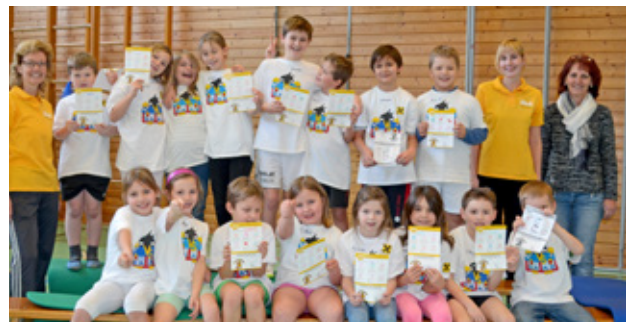
Nachdem einiges über den Körper und über Bewegung gelernt wurde, erhielten die Kinder der Ganztagesbetreuung eine Urkunde für die erfolgreiche Mitarbeit

Am 29. Jänner konnten sich die Schüler der Ganztagesbetreuung als „Körperdetektive“ beweisen. In spielerischer Form lernten die Kinder im Stationsbetrieb körperrelevante Themen wie Anatomie, Ernährung und Bewegung kennen. Jeder Einzelne war mit Begeisterung dabei, meisterte die Stationen mit Bravour und durfte sich danach urkundlich als „geprüfter Körperdetektiv“ bezeichnen.