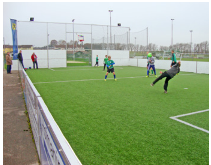
Im Bild der in Bad Wimsbach-Neydharting besichtigte Funcourt. Jener in Raab wird ebenfalls mit einem Kunstrasen versehen. Banden und Stirnseitenerhöhung werden jedoch in vergitterter Form ausgeführt

Das Grundstück, auf dem der Funcourt errichtet wird, sowie der Fußballtrainingsplatz befinden sich im Besitz des Oö. Fußballverbandes, sind jedoch an die Uni-