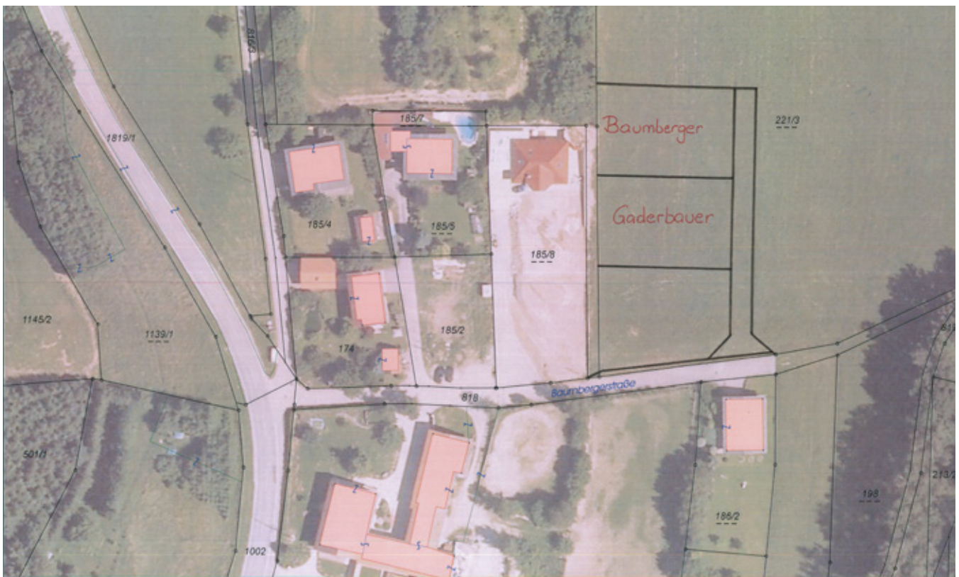
Zwei der drei umgewidmeten Baugrundstücke in der Baumbergerstraße wurden bereits verkauft

auf. Der Kaufpreis beträgt jeweils 26,00 €/m 2 . Eine dritte Parzelle im Ausmaß von 1.026 m 2 steht noch zum Verkauf.