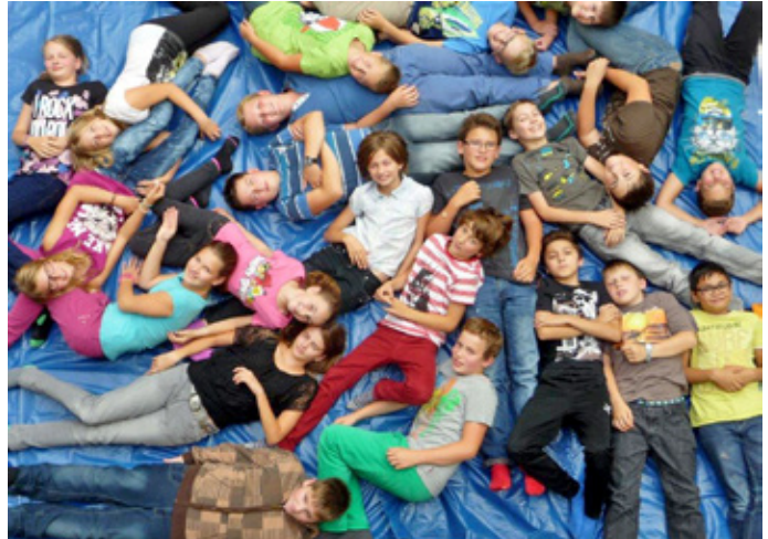
Die 2.A Klasse der Neuen Mittelschule möchte andere Kinder im Schulalltag unterstützen

Zeitplan. Die Schüler sind mit großem Engagement dabei und wollen das Projekt auf andere Schulstufen und auch auf die Volksschule ausweiten. Diese Initiative ist ein wichtiger Baustein der individuellen Förderung an der Neuen Mittelschule.