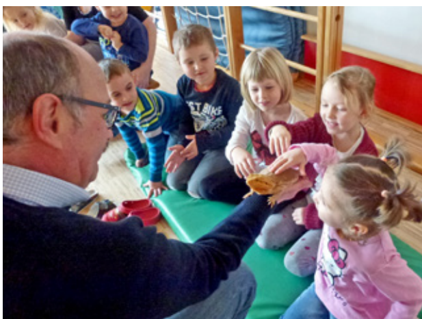
Die Kindergartenkinder durften die Reptilien, wie hier im Bild einen Leguan, auch anfassen