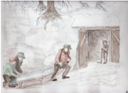
In der Vergangenheit wurde Eis in der Kellergröppe gelagert. Bei den dortigen Temperaturen wurde sichergestellt, dass es auch im Sommer nicht schmolz

Das Projekt Bau der WC-Anlage und Erweiterung des Eiskellers in der Kellergröppe ist handwerklich und künstlerisch fertig gestellt und wartet auf die ersten Besucher. Der künstlerische Teil der Museumserweiterung im sogenannten „Eiskeller“ ist dem Thema „Eisernte“ gewidmet.