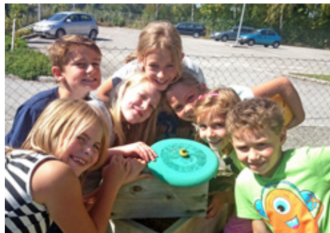
Wenn es das Wetter zulässt, dürfen die Kinder nach Erledigung der Hausaufgaben draußen spielen

Bei der Fülle an Spiel- und Bewegungsmöglichkeiten, die das Schulgelände bietet, kommt niemals Langeweile auf. Falls es die Witterungsbedingungen erlauben, können die Kinder den schuleigenen Garten, den Sportplatz sowie die Schulterrasse und den Schulhof unbeschwert zum Fangen-, Ballspielen oder zum Herumtollen nutzen. Bei Schlechtwetter lädt der großzügig ausgestattete Turnsaal zu lustigen Aktivitäten ein. Die Outdoor-Möglichkeiten werden