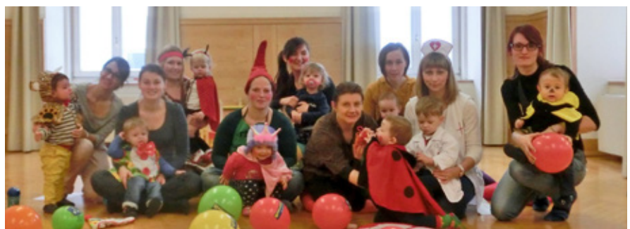
Die Kinder und Mütter der Spielgruppe haben sich für den Fasching lustig verkleidet