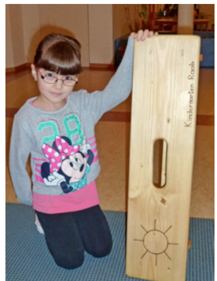
Auch die neuen Gartenhocker fanden großen Anklang

Auch Familie Hochhäusl gebührt großer Dank für acht neue Gartenhocker, die sie ebenfalls unentgeltlich für den Kindergarten getischt und gestaltet hat. Die Hocker sind bereits zum Genießen der ersten Sonnenstrahlen im Einsatz.