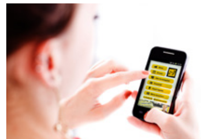
Mit der 4youCard-App muss keine extra Plastikkarte mehr mitgeführt werden

Diese Sicherheitsfeatures ermöglichen eine digitale Ausgabe der 4youCard, die ebenso als Lichtbildausweis in Altersnachweisfragen gültig ist, wie die 4youCard im Plastikkartenformat. Die 4youCard-App kann übrigens kostenlos im Google Play Store oder in iTunes downgeloadet werden. Sollten noch Fragen zur 4youCard auftauchen, schicken Sie bitte ein Mail an office@4yougend.at oder kontaktieren Sie das Team der 4youCard unter 0732 77 10 30.