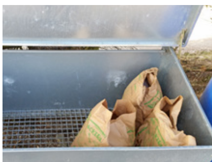
So sieht ein sauberer Biosack-Sammelplatz aus! Nur Biosackerl mit Bioabfall – ohne Plastik – dürfen in den Boxen bereitgestellt werden