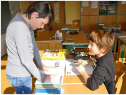
Schüler helfen anderen Schülern bei den Hausübungen oder beim Lernen vor Prüfungen