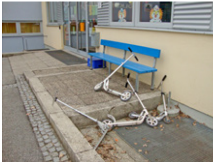
Die Unordnung vor der Volksschule gehört nun der Vergangenheit an

Platz und wurde so gebaut, dass er auch als Fahrradständer genutzt werden kann.