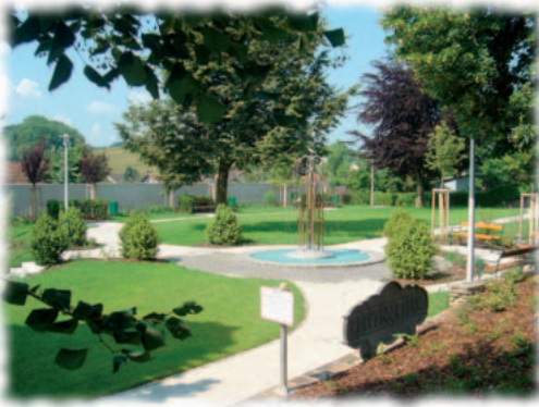
Der komplett neu gestaltete Sparkassenpark lädt jetzt wieder zum Verweilen ein. Ein angenehmes Platzl in der Nähe des Ortszentrums wurde geschaffen