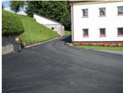
Die verbreiterte Kurve im Bereich Essl in Bründl

Bereits wieder instand gesetzt wurden die Güterwege Geizberg, Riedlhof und Wetzlbach. Es wurde dabei auch darauf geachtet, nicht nur die Schäden nach dem Kanalbau zu beseitigen, sondern unter Einbindung der Anrainer auch manche Verbesserungen durchzuführen. So wurde zum Beispiel an einigen Stellen die Ableitung von Oberflächenwässern durch das Setzen von Randleisten, die Instandsetzung von Gräben und Schächten oder eine Änderung der Straßeneigung verbessert. Besonders zu erwähnen ist die im Zuge der Straßenin-