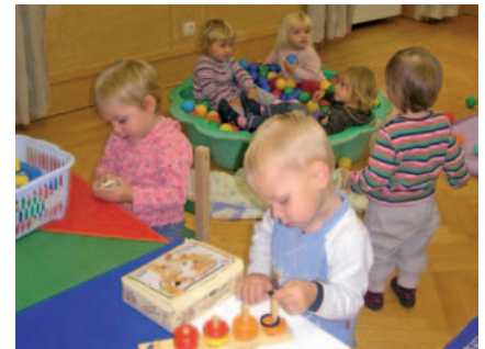
Die Spielgruppe startet ins neue Jahr

Die vier Spielgruppen machen Weihnachtspause. Ab Jänner wird aber wieder gemeinsam gesungen, Fingerspiele gespielt, gebastelt, gejausnet und gelacht. Eingeladen sind alle Kinder im Alter zwischen circa zehn Monaten und vier Jahren mit ihren Müttern oder Vätern.