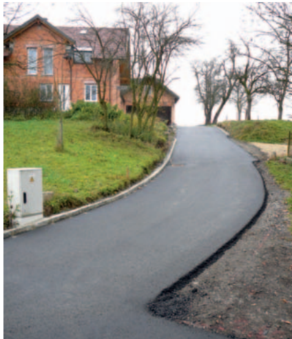
Die bisherige Schotterstraße in Billingsedt wurde ausgebaut

Auch im Jahr 2009 wurden wieder einige Straßenbauvorhaben verwirklicht. In Billingsedt wurde die bisherige Schotterstraße von der Liegenschaft Gruber bis zur Liegenschaft Schild in einer Länge von 100 m ausgebaut. Eine weitere schlecht ausge-