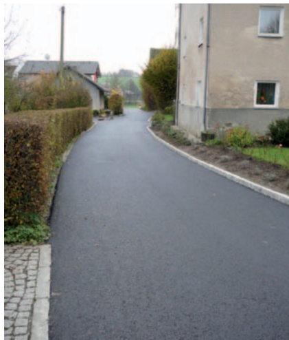
Die schlecht ausgebaute Moarhofstraße wurde nun instandgesetzt

baute und unbefestigte Straße bestand im Moarhof. Die Zufahrt zur Liegenschaft Stih wurde in einer Länge von 90 m ebenfalls instandgesetzt. Eine besondere Engstelle wies die Pausinger Straße entlang der ehemaligen Unterbuchsachnergründe auf.