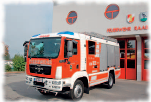
Das neue Tanklöschfahrzeug der Freiwilligen Feuerwehr Raab ist nun in den Dienst gestellt