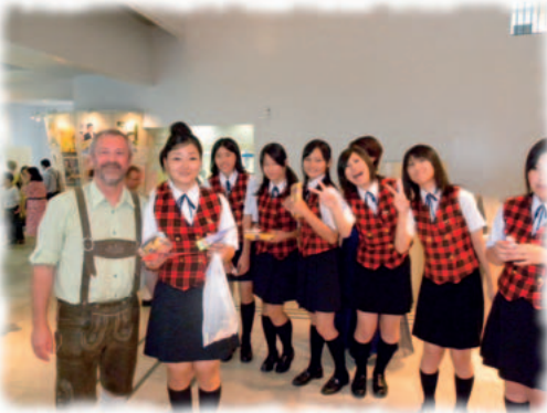
73 Raaberinnen und Raaber wurden in Japan herzlich aufgenommen