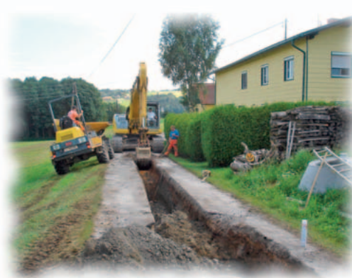
Der Kanalbau ist nun nach drei Jahren Bauzeit abgeschlossen