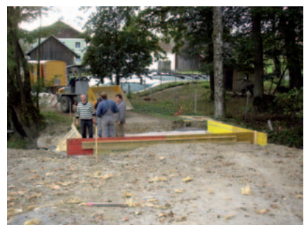
Notwendig war die Errichtung der neuen Brücke über den Ritzinger Bach

ausgelegt. Um einen Wasserrückstau bei Hochwasser zu vermeiden, wurde der Durchlass vergrößert. Da bisher in Ritzing auch die Versorgung mit Löschwasser im Brandfall problematisch war, wurde neben der Brücke eine Saugstelle für die Feuerwehren errichtet.