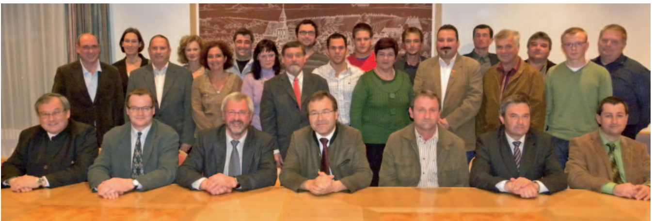
Der neugewählte Gemeinderat nach der Angelobung