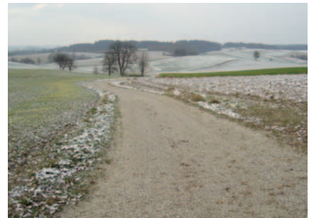
... und der Wirtschaftsweg in Thal in Blickrichtung B129