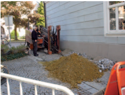
Auch das Gemeindeamt Raab ist nun am Glasfasernetz angeschlossen

Mit dem Anschluss des Gemeindeamtes an den oberösterreichischen Glasfaser-Backbone wurde wieder ein Schritt Richtung zukunftsweisende Technologien gesetzt. Auf Betreiben des Landes Oberösterreich sollen alle öö. Gemeinden in den Jahren 2009 und 2010 angeschlossen werden. Dafür erforderlich war eine Bohrung von der Schatzlgasse im Bereich des Seiteneinganges des Gemeindeam-