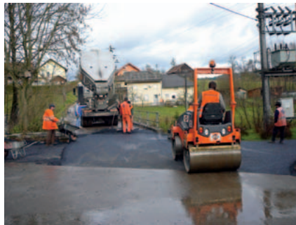
Alphaltierungsarbeiten in Riedlhof