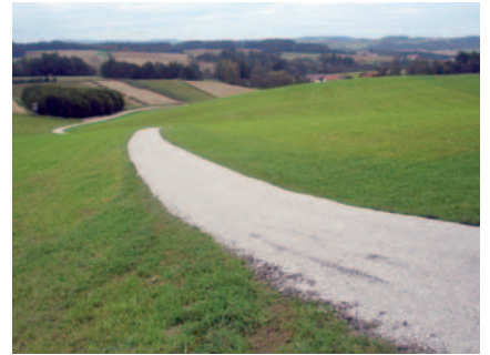
Der neu errichtete Wirtschaftsweg in Brünning ...

Auch im heurigen Jahr fortgesetzt wurde das Wirtschaftswegeprogramm. € 20.000,- werden jährlich für die Instandsetzung von landwirtschaftlichen Wegen und das Aufbringen einer doppelten Spritzdecke aufgewendet. Vom Land Oberösterreich und den Interessenten werden jeweils 25 % zur Finanzierung beigetragen. Die Sanierung der Wirtschaftswege Brünning in einer Länge von 430 m und Thal in einer Länge von 250 m wurden in der heurigen Etappe umgesetzt.