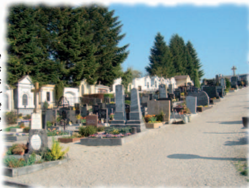
Im März gingen die Verwaltung des Friedhofes und das Eigentum an der Friedhofsliegenschaft von der Pfarre auf die Gemeinde über