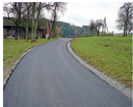
Der neu asphaltierte Ursprungweg