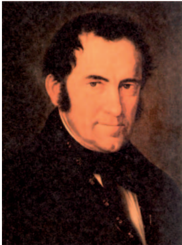
Franz Gruber komponierte die Melodie

Es war am 24. Dezember des Jahres 1818, als der damalige Hilfspriester an der St. Nikolaikirche zu Oberndorf bei Salzburg, Joseph Mohr, dem Lehrer und Organisten in Arnsdorf, Franz Gruber, welcher auch in St. Nikola den Organisten-dienst versah, ein Gedicht überreichte mit dem ansuchen, eine passende Melodie, für zwei Solostimmen und Chor, mit Gitarrenbegleitung setzen zu wollen.