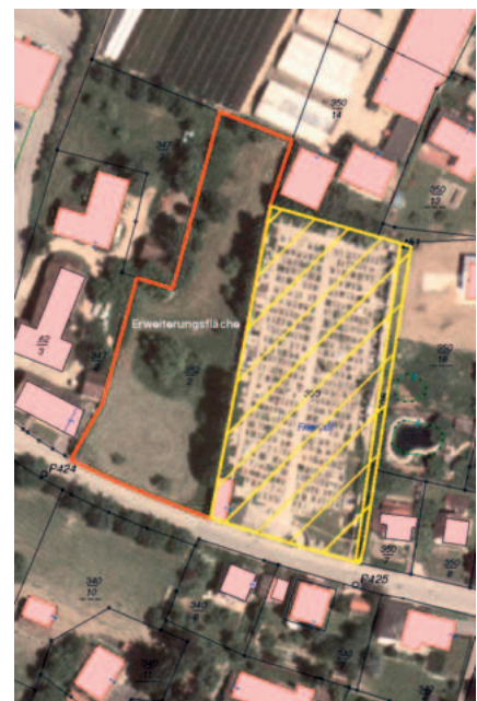
Gelb markiert der bestehende Friedhof, rot die Erweiterungsfläche

Die Parkplatzsituation im Bereich des Friedhofes ist derart prekär, dass eine Lösung dieses Problems oberste Prioritätsstufe haben soll. Daher wurde der Bauausschuss bezüglich der Situierung eines eventuellen Urnenhaines und der Parkplätze mit Friedhofszufahrt auf Grundstück Nr. 352/2 und der Friedhofsausfahrt auf Grundstück Nr. 353 beauftragt.