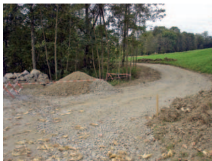
Der neu errichtete Weg zur Erschließung landwirtschaftlicher Grundstücke

sammenlegung am Nordufer des Baches entlang ein neuer Weg in einer Länge von 75 m errichtet. Die neue Brücke wurde den heutigen Anforderungen entsprechend gebaut. Da sie vor allem landwirtschaftlichen Fahrzeugen dienen soll, wurde sie breiter