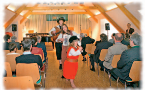
60 Jahre Musikschule und Lifteröffnung feierte die Landesmusikschule Raab mit einem Festakt und Tag der offenen Tür