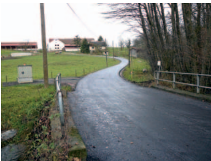
Der neu asphaltierte Güterweg Wetzlbach