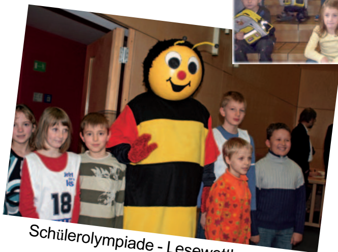
Schülerolympiade - Lesewettbewerb