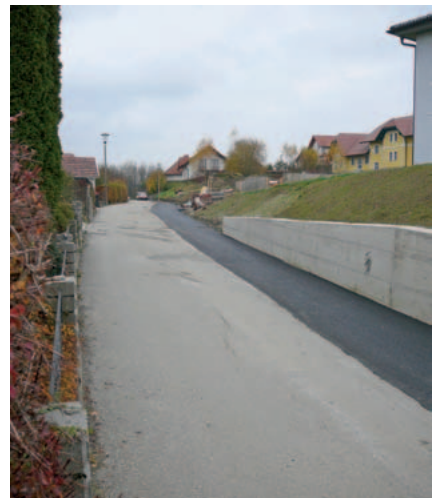
Die Verbreiterung der Pausinger Straße mit der neu errichteten Stützmauer

Mit der Verbreiterung war auch die Errichtung einer Stützmauer für die angrenzende Böschung notwendig. Eine weitere nicht asphaltierte Straße bestand in Ursprung. Auf Grund des guten Zustandes waren jedoch keine Maßnahmen am Unterbau der 100 m langen Straße erforderlich. Abgeschlossen wurden die jeweiligen Straßenbauvorhaben mit den Asphaltierungen im November. Die Gesamtbaukosten im heurigen Jahr betragen € 90.000,--.