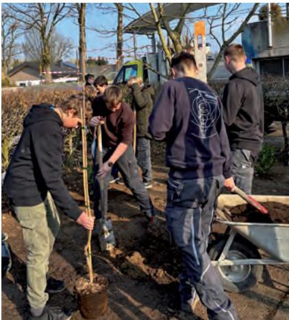
Die Schülerinnen und Schüler gestalteten den Schulgarten neu

Die Tour "Gemma Garten" im Rahmen der OÖ Job Week ermöglichte den Schülerinnen und Schülern der Mittelschulen Andorf und Raab wertvolle Einblicke in die grüne Branche. Dank der großzügigen Unterstützung von Garten Schmid aus Raab und der Baumschule Alois Stöckl aus Zell an der Pram konnten die Jugendlichen hautnah erleben, wie vielseitig Berufe in der Garten- und Landschaftsgestaltung sind. Gleichzeitig wurde die Bedeutung regionaler Familienbetriebe als starke Säulen der Wirtschaft und Ausbildung sichtbar.