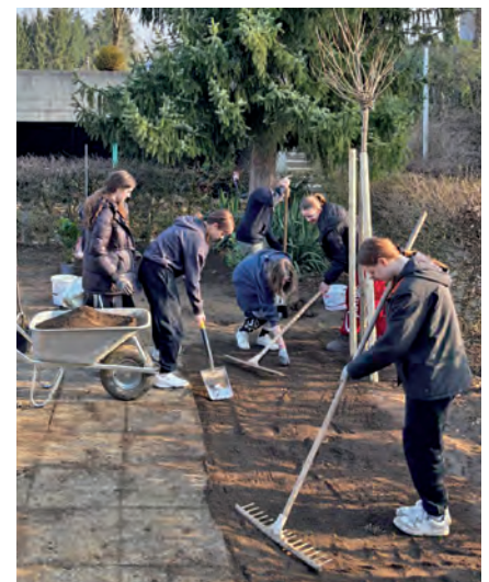
Mit Schaufel und Rechen wurde von den Schülern Hand angelegt

Die Tour „Gemma Garten“ vermittelte nicht nur praxisnahe Einblicke in Berufe, sondern auch nachhaltige Werte. Sie zeigt, wie stark das Zusammenspiel von Wirtschaft, Bildung und Gemeinde die Region fördern kann. Ein zentraler Impuls kam von der WKO Schärding, die das Projekt initiiert und wesentlich zur Umsetzung beigetragen hat. So entstand ein Vorzeigeprojekt, das nachhaltige Perspektiven für junge Fachkräfte schafft und den regionalen Arbeitsmarkt stärkt.