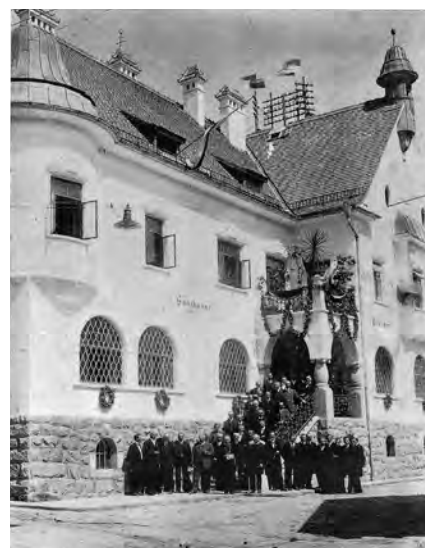
Neubau 1920 für Sparkasse, Post und Gendarmerie Raab

Mit Ende 2025 wird der ehemalige Hauptbetrieb in Raab eingestellt. Von den ehemaligen sechs Zweigstellen bleiben vorläufig nur noch Andorf und Riedau übrig.