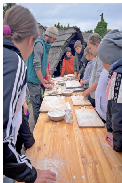
Brotbacken wie zur Keltenzeit

Am 8. Mai unternahmen die Schülerinnen und Schüler der 2. Klasse eine spannende Reise in die Vergangenheit: Ziel war das Keltendorf Mitterkirchen. Nach einer interessanten Führung durch das nachgebaute eisenzeitliche Dorf bekamen die Kinder in drei Workshops die Möglichkeit, selbst aktiv zu werden. Sie buken Brot wie zur Keltenzeit, versuchten sich im Bogenschießen und stellten ihren eigenen Metallschmuck her.