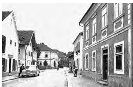
Erste Kanzlei der Sparkasse Raab (rechts), heute Hauptstraße 14 (Fitnessstudio)