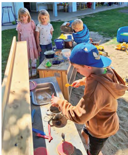
Mit Matsch und Fantasie - Kinder entdecken spielerisch das Kochen

Seit diesem Frühjahr bereichert eine besondere Neuheit den Garten des Kindergartens: die Matschküche! Aufgestellt im Rahmen der Umgestaltung des Außenbereichs nach dem Umzug der Krabbelstube befindet sich die neue Spielstation bei der oberen Sandspielfläche und ist seitdem ein echter Magnet bei den Kindern.