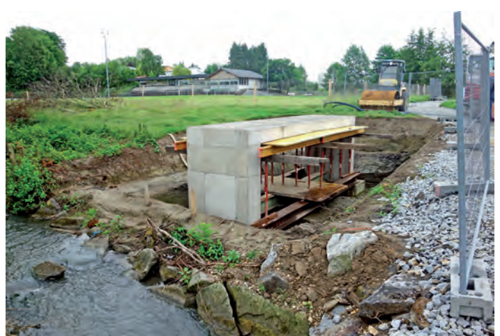
Der neue Steg im Bereich Sportzentrum vor der Umlegung des Gewässers

In den kommenden eineinhalb Jahren folgen neben dem Bereich