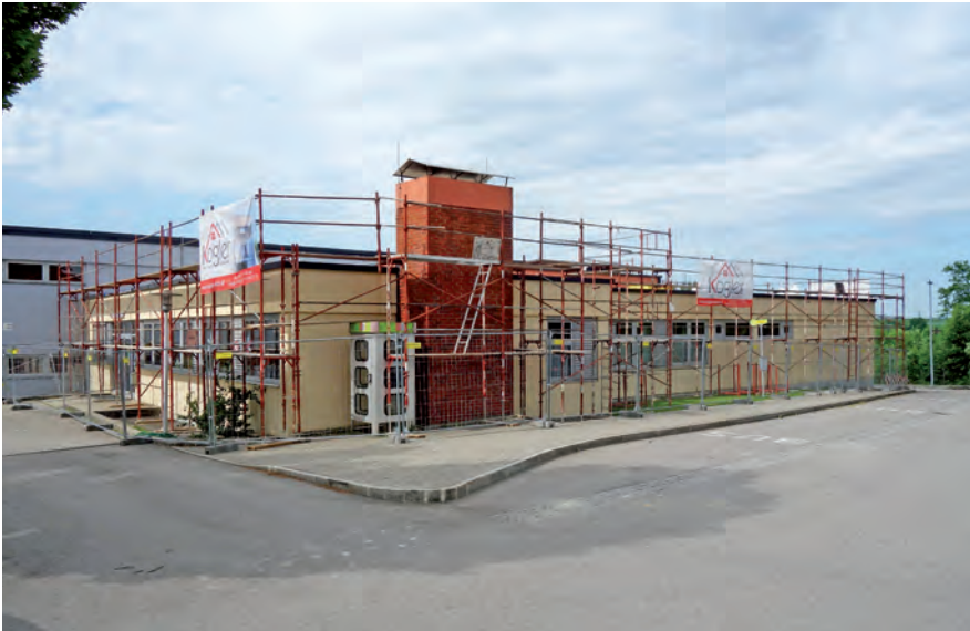
Mit einer Dachsanierung und der Anbringung eines Vollwärmeschutzes wird die Volksschule energetisch auf den neuesten Stand gebracht

Modernisierung investiert. Davon übernimmt das Land Oberösterreich etwa 600.000,00 € in Form von Fördermitteln. Die restlichen 400.000,00 € werden aus Rücklagen, einem Bankdarlehen und Schulerhaltungs- und Gastschulbeiträgen anderer Gemeinden finanziert.