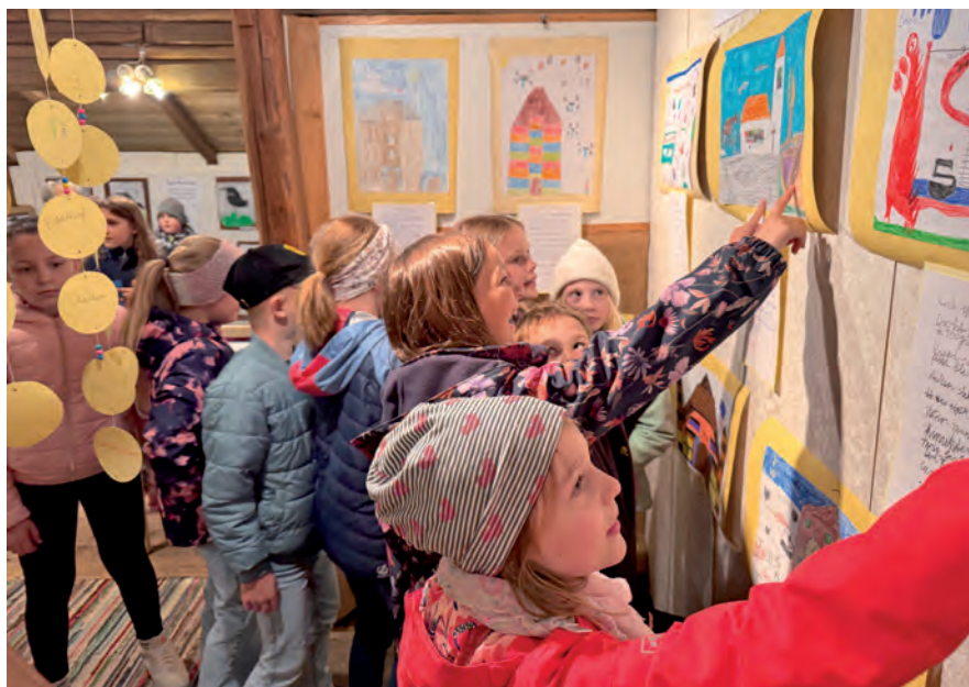
Die Volksschulkinder betrachten ihre eigene gestaltete Ausstellung

vor dem Start am 1. Mai die Reinigung der Dachflächen vorgenommen. Unter Einhaltung der entsprechenden Sicherheitsvorkehrungen wurden Laub und Erdreich entfernt. In den Kellern erfolgt regelmäßig eine Kontrolle auf Schimmelbefall und Ähnliches. Diese Arbeiten sind notwendig, damit sich die Kellergröppe und die Museumskeller in voller Schönheit präsentieren können. Es wird jedoch nicht nur gearbeitet: Die monatlichen Stammtische sind ein Garant für Gemütlichkeit. Wie schon in den Jahren zuvor plagt den Verein „Raaber Museen“ ein Mangel an neuen Mitarbeitern. Es besteht großer Bedarf an Unterstützung – sowohl für handwerkliche Tätigkeiten als auch für Führungen in allen drei Museen. Auf zahlreiche Besucher in den Museen des Vereins „Raaber Museen“ freut sich das gesamte Team.