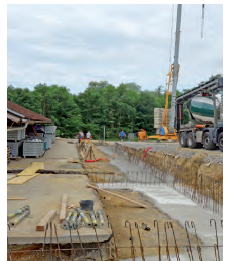
Die fertigen Fundamente für die Erweiterung des ASZ-Betriebsgebäudes

Die eigentliche Erweiterung des Altstoffsammelzentrums wird vom Bezirksabfallverband Schärding umgesetzt. Sie ist notwendig geworden, da die derzeitige Anlage ihre Kapazitätsgrenzen erreicht hat. Zudem soll eine geordnete Zu- und Abfahrtsituation geschaffen werden soll.