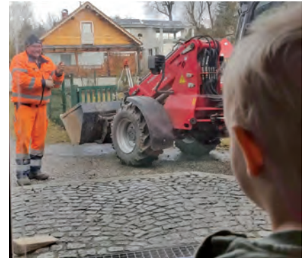
Was ist denn hier los? Gebannter Blick aus dem Fenster

und Gemüse direkt vom Strauch freuen. Ganz nebenbei erfahren sie, wie wertvoll Natur ist – und wie spannend es sein kann, beim Wachsen zuzusehen. Das Team des Gemeindebauhofes hat den Umbau mit viel Einsatz möglich gemacht. Die Kinder waren übrigens ganz nah dran – sie beobachteten Bagger, halfen beim Gießen und werden auch weiterhin bei der Gartenpflege mit einbezogen. So lernen sie spielerisch, Verantwortung zu übernehmen – ganz im Sinne einer partizipativen und wertschätzenden Pädagogik. Fazit: Der Krabbelstubengarten ist jetzt nicht nur ein Ort zum Spielen, sondern ein Ort des gemeinsamen Wachsens – für kleine Hände, große Ideen und viele strahlende Kinderaugen.