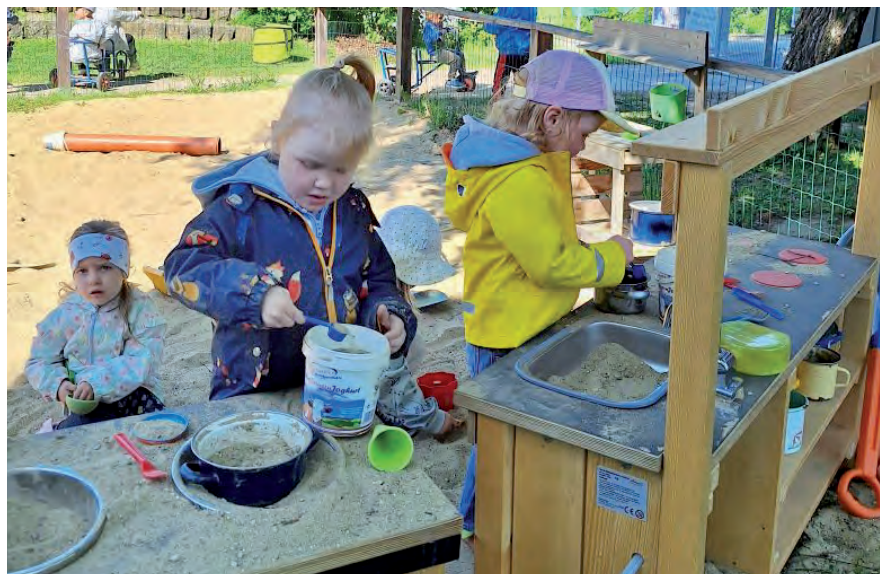
Kreatives Lernen in der Matschküche: Wo kleine Hände große Ideen haben

Fazit: Die leuchtenden Kinderaugen, die kreativen „Kochshows“ und das fröhliche Miteinander sind der schönste Lohn. Die Matschküche ist eine echte Bereicherung – für den Kindergartenalltag und die Entwicklung der Kinder.