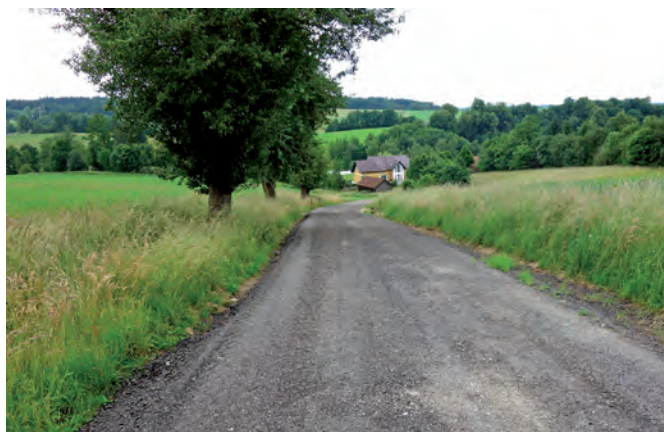
Der instandgesetzte Wirtschaftsweg Moarweg

Am Wirtschaftsweg Schleifen sind kleinere Instandhaltungsarbeiten mit geschätzten Kosten in der Höhe von 2.500,00 € vorgesehen. Diese umfassen das Auffüllen der Fahrspuren sowie das Verdichten des eingebrachten Materials. Die Finanzierung erfolgt mittels Interessentenbeiträgen.