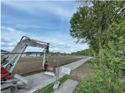
Die derzeitige Baustraße bleibt als künftiger Uferbegleitweg erhalten

Ein bedeutender Schritt in Richtung ökologischer Aufwertung wird mit der Renaturierung des Raaber Baches und des Bründlbaches gesetzt. Der Baustart erfolgte am 7. April im Bereich des Sportzentrums. Als erste Maßnahme wurde eine geschotterte Baustraße in Richtung Moarhof angelegt, die den bisherigen Gehweg ersetzt.