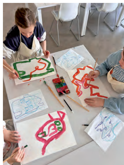
Mit großer Begeisterung durfte man selbst kreativ werden und eigene kleine Kunstwerke schaffen

Am 4. April unternahmen die Schülerinnen und Schüler der 2. Klassen einen spannenden Ausflug ins Museum Angerlehner in Thalheim bei Wels. Gleich zu Beginn bekamen die Kinder eine interessante Führung durch das Museum, bei der sie viele faszinierende Informationen über die ausgestellten Kunstwerke und die Arbeit der Künstlerinnen und Künstler erhielten. Besonders begeistert waren die Schülerinnen und Schüler vom anschließenden Workshop. In diesem ging es darum, wie Künstlerinnen und Künstler neue Ideen entwickeln und daraus kreative Werke schaffen. Dabei durften die Kinder selbst aktiv werden und ihrer Fantasie freien Lauf lassen. Mit viel Begeisterung wurde gemalt, gestaltet und ausprobiert. Der Ausflug bot nicht nur einen abwechslungsreichen Zugang zur Kunst, sondern weckte bei vielen auch das Interesse am eigenen kreativen Schaffen. Ein gelungener Tag voller Inspiration und neuer Eindrücke!