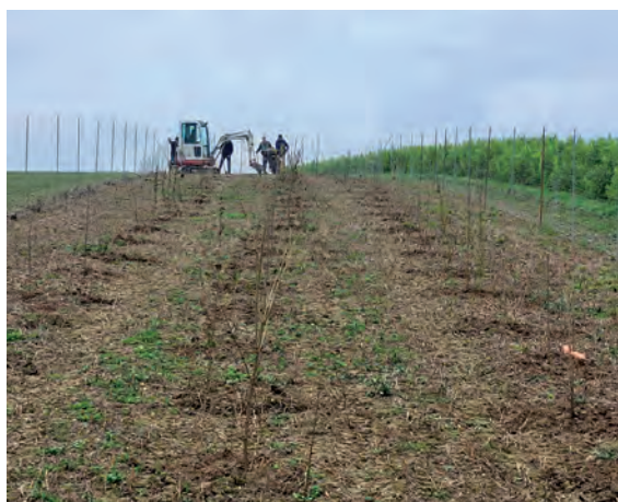
Anpflanzung der Wildhecke

hölze wie z.B. Haselnuss, Schwarzdorn, Schlehdorn, Hagebutte und Kornelkirsche verwendet. Diese Pflanzenarten sind an die Umgebung bestens angepasst und weisen deshalb eine hohe ökologische Wertigkeit auf.