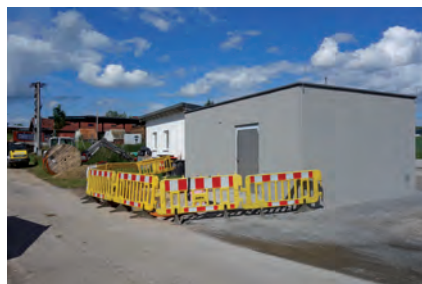
Das „Herz“ des Glasfasernetzes in Raab – der „Point of Presence (POP)“ im Gewerbegebiet