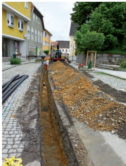
Glasfaserausbau in der Marktstraße