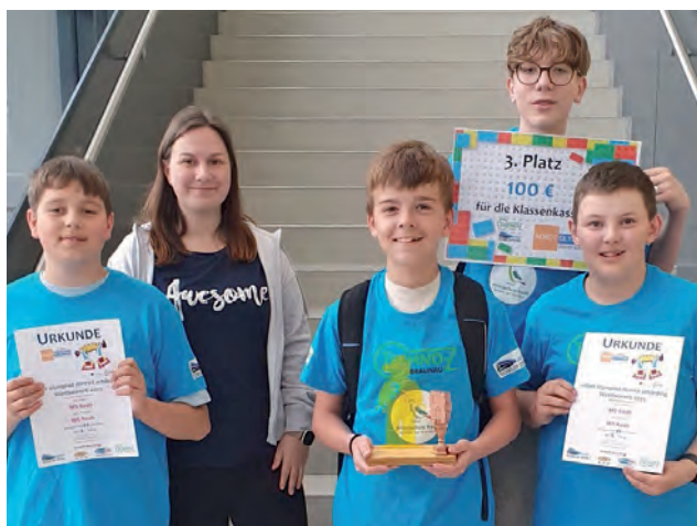
Die stolzen Teilnehmer der Robot Olympiad

Nach mehreren Wochen intensiver Vorbereitung nahm ein Team der 3. Klassen an der Robot Olympiad District Schärding teil. Insgesamt zwölf Teams stellten sich spannenden technischen Herausforderungen – und der Einsatz der Raaber Schüler wurde mit dem 6. Platz in der Teamwertung belohnt. Noch größer war die Freude über den 3. Platz in der Schulwertung, der den 3. Klassen zusätzlich 100,00 € für die Klassenkasse einbrachte. Die Teilnahme am Wettbewerb war für die Schüler nicht nur ein spannendes Erlebnis, sondern auch eine großartige Gelegenheit, ihre Kreativität und Teamfähigkeit unter Beweis zu stellen. Die Vorfreude auf die Robot Olympiad im nächsten Jahr ist groß – die Motivation ist hoch, erneut das Beste zu geben.