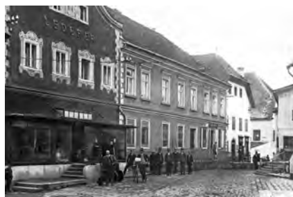
Zweite Kanzlei der Sparkasse Raab, ehemalige Apotheke (2. Haus links) heute Neubau Raiffeisenbank, Marktstraße

Die Einlagen nahmen eine inflationäre Entwicklung, die Ausleihungen stagnierten und die vorhandenen Mittel mussten in Wertpapieren, vornehmlich in Kriegsanleihen, angelegt werden. Den Gemeinden Raab und Riedau wurden beträchtliche Mittel zur Zeichnung von Kriegsanleihen zur Verfügung gestellt.