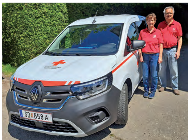
Das neue Elektroauto der Sozialdienstgruppe

Im Bezirk Schärding wird „Essen auf Rädern“ in allen 30 Gemeinden angeboten. Im Jahr 2024 wurden dort fast 170.000 Portionen ausgeliefert.