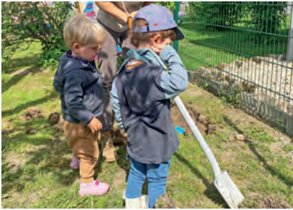
Die Kinder unterstützten, wo es nur möglich war