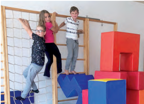
Viele Kinder besuchten wieder den Spiele-Sommer

Am Plan stand gemeinsames Spielen von Gesellschaftsspielen, malen und basteln, bauen mit Holzbausteinen