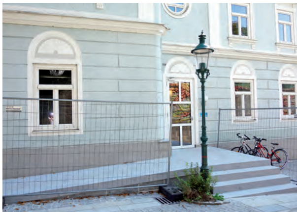
Der neue Zugang zum Gemeindeamt