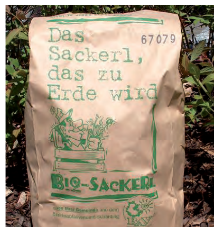
Biosackerl am Gemeindeamt erhältlich

det werden. Das Aluminium wird eingeschmolzen und kann wieder neu verwendet werden. Pads und Kapseln aus anderen Materialien bitte in der Restabfalltonne entsorgen! In das Biosackerl dürfen nur Pads, die zu 100 % kompostierbar sind. Bitte vorsichtig sein mit Cappuccinopads, die außen aus einem „Fließmaterial“ bestehen. Diese enthalten sehr oft im Inneren ein „Plastikrad“ und dürfen somit keinesfalls in das Biosackerl, sondern müssen in die Restabfalltonne.