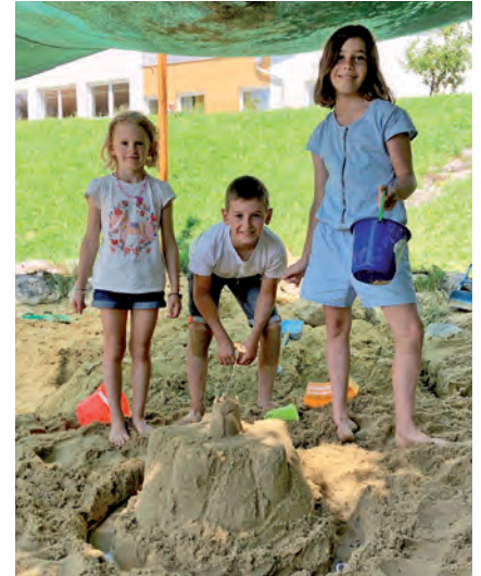
Wenn es das Wetter zuließ, wurde immer im Garten gespielt

gungslandschaft erschaffen wurde. Außerdem waren auch die für den Innenbereich angebotenen Fahrzeuge ein beliebter Zeitvertreib. Nicht nur die Kinder, sondern auch die Betreuerinnen hatten eine tolle und lustige Zeit!