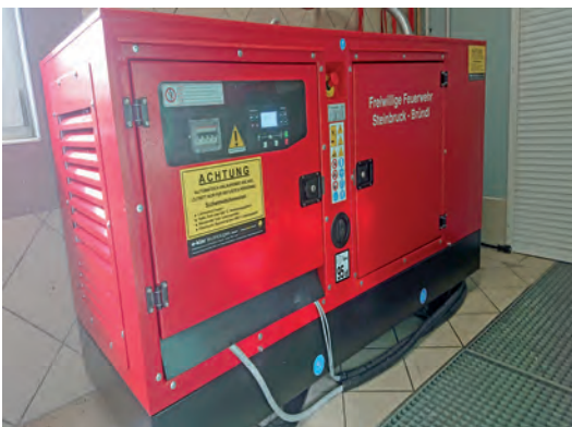
Mit dem neuem Notstromaggregat ist die Einsatzbereitschaft sichergestellt

ist auch eine zeitgemäße Ausstattung der Feuerwehren zur Aufrechterhaltung ihrer Einsatzbereitschaft. Um die Einsatzbereitschaft von Fahrzeugen und der Infrastruktur des Feuerwehrhauses bei einem längeren Stromausfall zu gewährleisten wurde das Gebäude der FF Steinbruck-Bründl im heurigen Sommer mit einem 44-kVA-Notstromaggregat