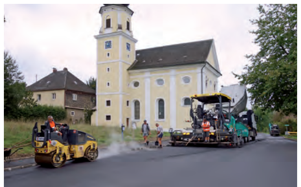
Die Firma Swietelsky Bau AG bei den Asphaltierungsarbeiten

Die abschließende Asphaltierung des gesamten Bereiches erfolgte durch die Firma Swietelsky Bau AG, Taufkirchen/Pram.