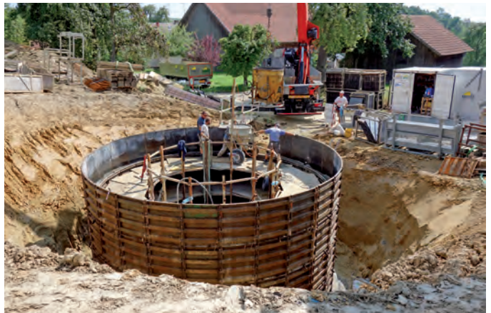
Aufgrund des schlechten Zustandes des bestehenden Löschteichs war ein neuer Löschwasserbehälter in Krennhof notwendig

Kriterien für die Wahl des Standortes waren eine gute Zufahrtsmöglichkeit sowie eine zentrale Lage im zu versorgenden Gebiet. Vom Eigentümer des Grundstückes Nr. 600, KG Oberspitzling, wird eine Teilfläche dessen kostenlos zur Verfügung gestellt. Diese befindet sich unmittelbar neben dem Güterweg Krennhof. Ein entsprechender Dienstbarkeitsvertrag zwischen Grundeigentümer und Gemeinde wurde vom Gemeinderat genehmigt.