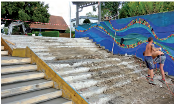
Während der Sommerferien wurden die Zugangsstiegen zu den Schulen neu errichtet

Die Arbeiten wurden durch die Firma Neulinger & Leidinger Transporte GmbH, Raab, und die Firma Milleder, Zell/Pram, durchgeführt. Die Gesamtkosten betragen 35.000,00 €. Diese werden durch eine Entnahme aus der Ansparrücklage in der Höhe von 20.000,00 € und einen Zweckzuschuss gemäß Kommunalinvestitionsgesetz 2020 („Gemeindemilliarde“) in der Höhe von 15.000,00 € finanziert.