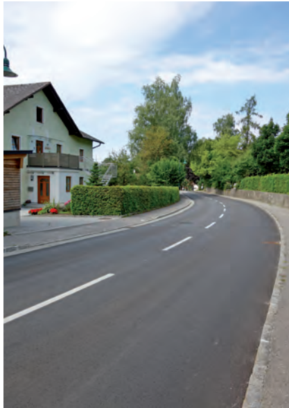
Neuer Straßenbelag in der Marktstraße – im Hintergrund die Liegenschaft Probst

damit ein Großteil der Vorbereitungs- und Asphaltierungskosten wurden vom zuständigen Straßenerhalter, dem Land Oberösterreich, getragen.