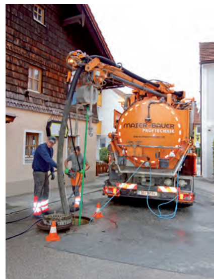
Die Überprüfung der gesamten Kanalisationsanlage erfolgte durch die Firma Maier-Bauer Prüftechnik GmbH, Raab