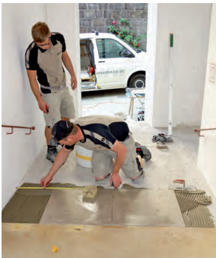
Die Firma Hörmanseder beim Verlegen der neuen Fliesen