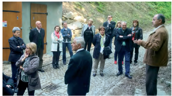
Die spannenden Führungen durch die Kellergröppe kommen bestens an

Die Kulturvermittler in der Kellergröppe können derzeit nicht über Besuchermangel klagen. Natürlich ist die Nachwirkung von „9 Plätze - 9 Schätze“ zu spüren. Eine Vielfalt von Interessierten trifft sich in der Kellergröppe: Einzelbesucher z.B. aus Vorarlberg und anderen Bundesländern, Seniorengruppen aus ganz Oberösterreich, Radler, Wanderer und Besucher aus Deutschland, die von unserem Naturjuwel gehört haben. Zum „Service“ gehören auch Wanderungen mit Besuchergruppen. Ein gutes Feedback ist die beste