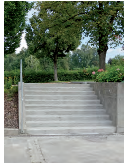
Rechtzeitig vor Schulbeginn wurden die Stiegen fertig gestellt