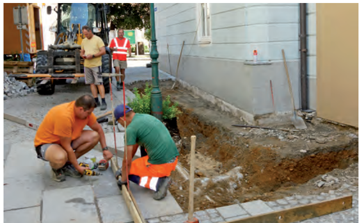
Durch die Straßenmeisterei Raab wurde eine Rampe für den barrierefreien Zugang errichtet

Aus diesem Grund sind Maßnahmen zur Beseitigung des Schimmels und die Sanierung des Raumes notwendig. Dazu wurden folgende Aufträge erteilt: