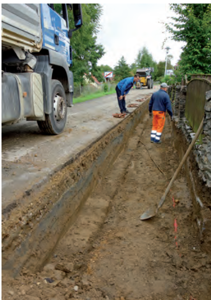
Vor der Asphaltierung wurden Glasfaserleitungen verlegt

Das Straßenteilstück zwischen der Bründllallee und der ersten Kreuzung im Bereich der Liegenschaft Freund sowie der Parkplatz und Gehsteig vor der Bründlkirche befanden sich