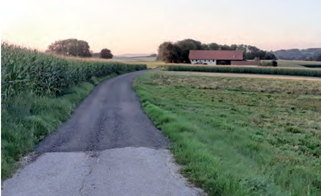
Die Zufahrt zur Liegenschaft Gautzham 3 und ein Teil des ...

und eines Teilstückes des WW Ritzing konnten damit deutlich verbessert werden. Am WW Ritzing wurde zudem für eine bessere Entwässerung des Weges durch beidseitiges Abwasen gesorgt.