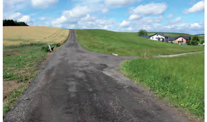
... WW Ritzing konnten durch Fräsmaterial verbessert werden