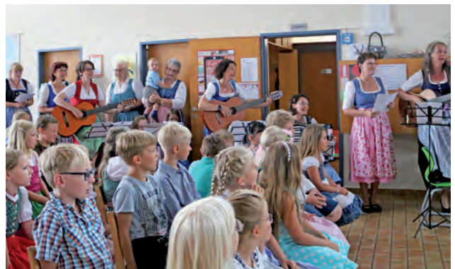
Die Lehrkräfte bereiteten mit den Schülern eine tolle Abschiedsfeier vor