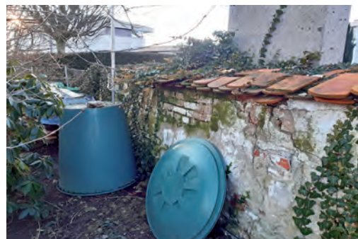
Wegen gravierender Schäden musste die Friedhofsmauer saniert werden