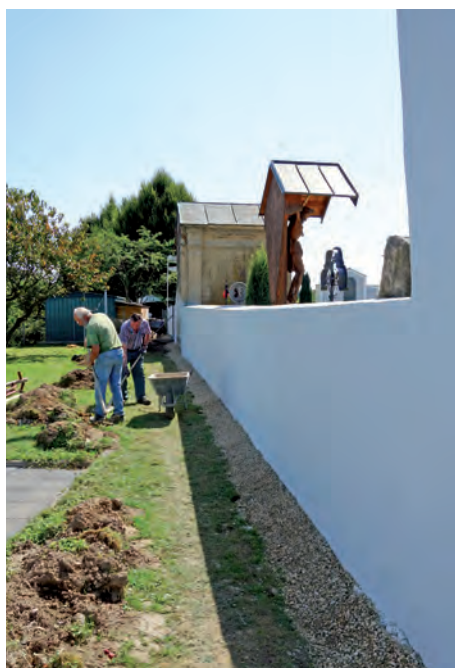
Die Sanierung der Friedhofsmauer erfolgte größtenteils durch den Bauhof

Jedes Jahr werden kleinere und größere Baustellen am Friedhof abgewickelt, nachdem dieser vor 13 Jahren von der Gemeinde übernommen wurde. Heuer war der nördliche Teil der Friedhofsmauer an der Reihe. Die Mauer war größtenteils mit Efeu und wildem Wein bewachsen. Das darunterliegende Mauerwerk aus Stein und Ziegel war durch den Bewuchs und Witterungseinflüsse stark in Mitleidenschaft gezogen. Die Mauerabdeckung befand sich ebenfalls in einem schlechten Zustand bzw. war eine solche teilweise gar nicht mehr vorhanden.