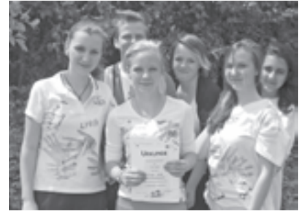
Die Schüler der Neuen Mittelschule erhielten das bronzene Leistungsabzeichen in Erste Hilfe

leisten zu müssen. Nur wenige Minuten oder Handgriffe können über Leben und Tod entscheiden und so den Ersthelfer zum Lebensretter werden lassen. Kompetent und engagiert bringen sich diese Jugendlichen beim Lernen fürs Leben ein!