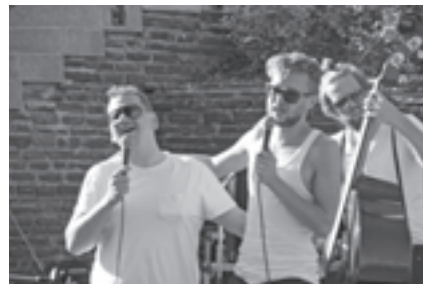
Die Mundartband 5/8erl in Ehr'n unterhielt die Zuschauer im Sparkassenpark

dition der Buchdrucker, wurden die ehemaligen Lehrlinge auf eine etwas