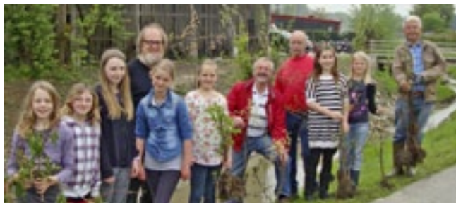
Einige Schüler der Neuen Mittelschule halfen fleißig bei der Bepflanzung mit

und Fleiß einen Beitrag zur Verbesserung des Erscheinungsbildes des renaturierten Raaber Baches. Schüler der Neuen Mittelschule Raab hatten auch bereits bei der Entstehung des Projektes zur Renaturierung mitgewirkt. Als Dank für die Unterstützung wurden die Schüler nach getaner Arbeit mit einer Jause und Getränken belohnt. Durch die Mitarbeit wurde der Bezug zum unmittelbaren Lebensraum Natur sicherlich gefestigt und die Schüler werden sich noch nach Jahren an die selbst gepflanzten Bäume und Sträucher erinnern.