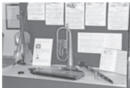
In neun Vitrinen werden verschiedenste Themen aus der Zeit um 1813 dargestellt

Die Ausstellung bietet einen umfassenden Einblick in das Leben anno 1813. In neun Vitrinen werden Ausstellungsstücke mit den Themen Musik, Priester und Sakrales, Mode, Geld und Zahlungsmittel, Essen und Trinken, Land- und Ansichtskarten und vieles mehr aus der Zeit um 1813 gezeigt. Das Handwerk hatte um diese Zeit in Raab eine große Bedeutung. Die Neue Mittelschule Raab gestaltete 37 Zunftzeichen aus der Zeit.