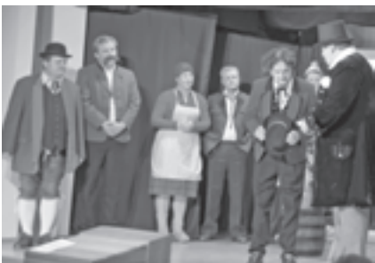
Die Geschichte zur Verleihung des Marktrechtes wurde beim Historienspiel von der Theatergruppe nachgestellt

Fließend war der Übergang zum Raaber Treffen, wozu die Gemeinde mehr als 900 ehemalige Raaber eingeladen hatte. Ziel dieses Treffens war es, die Möglichkeit für interessante Begegnungen – vielleicht mit Freunden und Bekannten aus der Jugendzeit – zu schaffen, was auch tatsächlich gelun-