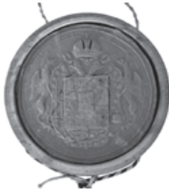
... und nach der Restaurierung

mehrere Siegelstempel des Kaiserreichs gab, die sich nur in winzig