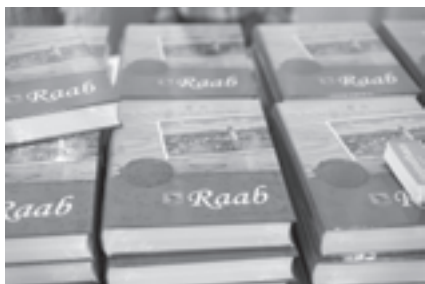
Das fertige Heimatbuch ist am Gemeindeamt erhältlich

Die Marktgemeinde Raab feiert heuer das 200-Jahr-Jubiläum der Markterhebung. Die erste von vielen Veranstaltungen war die Präsentation des neuen Heimatbuches am 23. März, bei der zahlreiche Besucher begrüßt werden konnten.