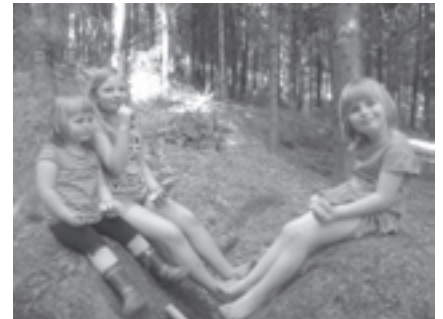
Viel Spaß haben die Kinder beim gemeinsamen Spielen in der Spielgruppe

Damit eine Spielgruppe bestehen kann, sind Gruppenleiterinnen notwendig. Deshalb werden, dank dem großen Andrang und Interesse, neue Spielgruppenleiterinnen gesucht.