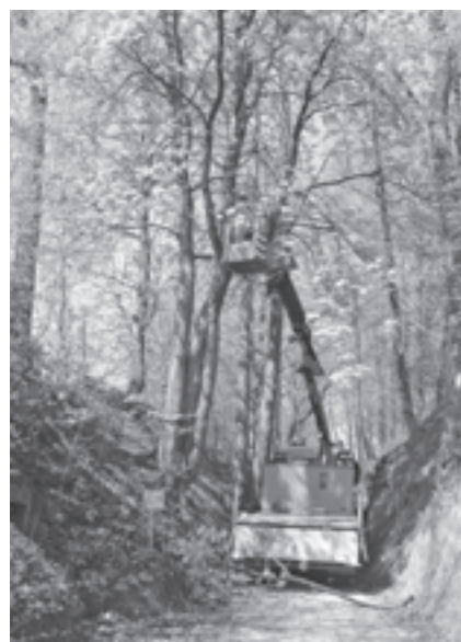
Nur durch eine entsprechende Pflege behält die Kellergröppe ihr besonderes Ambiente

Um aber ein gefahrloses Nutzen der Kellergröppe gewährleisten zu können, war ein Ausästen des Bewuchses nun dringend erforderlich. Die bewachsenen Grundstücke links und rechts des Weges befinden sich in Privatbesitz, lediglich der Weg ist öffentliches Gut und im Eigentum der Gemeinde. Die Straßenmeisterei Raab verfügt über die für die Durchführung der Arbeiten notwendige Ausrüstung und fachkundiges Personal und stellte sich für diese Arbeiten zur Verfügung. Das angefallene Schnittgut wurde von den jeweiligen Anrainern entfernt.