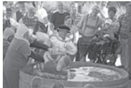
Bei der Buchdruckertaufe wurden die ehemaligen Lehrlinge buchstäblich ins kalte Wasser geworfen

Mit dem Festbieranstich wurde das Festwochenende offiziell eröffnet, danach übernahm die Marktmusikkapelle Raab die musikalische Umrahmung. Bei einer Gautschfeier, einer lang gehegten Tra-