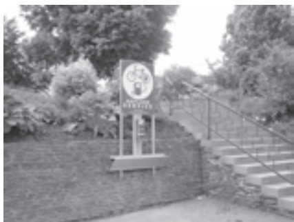
Die Ladestation kann von jedem genutzt werden

Am Parkplatz des Sparkassenparks wurde eine E-Ladestation für E-Bikes errichtet. Sie ist öffentlich zugänglich und kann von jedermann genutzt werden. Damit soll dem herrschenden großen E-Bike-Boom Rechnung getragen werden.