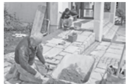
Für einen barrierefreien Aufgang wurde eine Rampe beim Pfarrheim errichtet

Seit einigen Jahren widmet sich die Gemeinde der barrierefreien Gestaltung des Ortes und Erreichbarkeit öffentlicher Gebäude. Dem hat sich nun auch die Pfarre angeschlossen. Durch den Gemeindebauhof wurde eine gepflasterte Rampe beim Pfarrhof errichtet, die Materialkosten übernahm die Pfarre. Damit wurde nun eine weitere Barriere für gehbehinderte Personen entfernt.