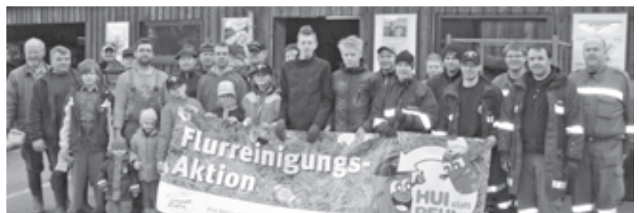
Gemeinsam wurde das Gemeindegebiet gesäubert

Auch die Schüler der Volksschule und Neuen Mittelschule Raab beteiligten sich und säuberten den Bereich um das Schulzentrum über den Güterweg Schleifen bis zur Kellergröppe.