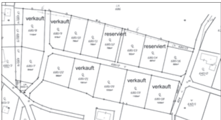
5 Bauparzellen sind wurden bereits verkauft, 2 sind reserviert

beträgt 26,00 €/m 2 . Damit konnten bereits fünf der geschaffenen 14 Parzellen verkauft werden.