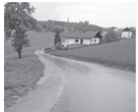
Beim Güterweg Ungering wurde die Entwässerung verbessert und ein neuer Belag aufgebracht

Der Güterweg Ungering befand sich bereits seit längerem in einem sehr schlechten Zustand und deshalb bereits mehrere Jahre auf der Sanierungsliste des Wegeerhaltungsverbandes Innviertel. Im heurigen Frühjahr war es nun so weit. Auf einer Länge von rund 390 m wurde ein neuer Belag aufgebracht. Zuvor erfolgte im Bereich der Liegenschaften Kopfberger und Gumpinger in Zusammenarbeit mit den Anrainern eine Instandsetzung und Verbesserung der Entwässerung.