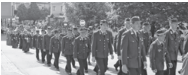
Für Unterhaltung Nach dem Gottesdienst wurde in die Neue Mittelschule marschiert

gen ist. Später wurde beim Historienspiel auf lustige Art und Weise gezeigt, wie es zur Verleihung des Marktrechtes gekommen war.