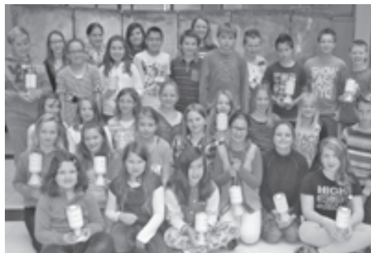
Fleißig wurde für die Krebshilfe Spenden gesammelt

33 Schüler der 1. Klassen der Neuen Mittelschule Raab waren mit Sammelbüchsen in ihrer Freizeit in Raab und Umgebung unterwegs, für einen guten Zweck um Spenden zu bitten. Ein ausgezeichnetes Sammelergebnis in der Höhe von 1.252,83 € konnte an die Krebshilfe überwiesen werden. Herzlichen Dank an die Schüler für diesen selbstlosen Einsatz!