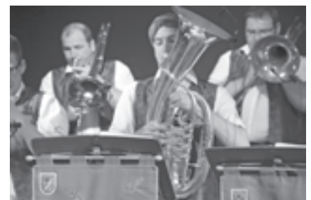
Für gute Stimmung im Festzelt sorgte die Blaskapelle Ceska

Am Sonntag fand ein Festgottesdienst statt. Im Anschluss daran wurde im Festzug in die Neue Mittelschule marschiert. Unter der Moderation von Walter Egger, der mit dem einen oder anderen Schmah beim zahlreich er-