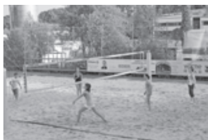
Jeder kann den Beachvolleyballplatz frei benutzen