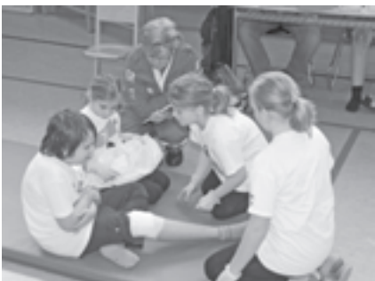
Die Kinder der Volksschule lernen, wie wichtig Erste Hilfe ist

Außerdem gab es ein Rahmenprogramm. Dazu gehörte ein Juxbewerb, Führungen in den Raaber Sandkellern, ein Kino, Besichtigung von Einsatzfahrzeugen der Feuerwehr, Poli-