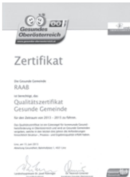
Die Gesunde Gemeinde Raab wurde durch ein Qualitätszertifikat ausgezeichnet

Der Arbeitskreis der Gesunden Gemeinde unter Leitung von Anita Schwarzgruber bemüht sich um ein abwechslungsreiches und gesundheitlich anspruchsvolles Veranstaltungsangebot. Das Qualitätszertifikat wurde für den Zeitraum 2013 bis 2015 verliehen. Es wird nun bereits wieder fleißig an der Umsetzung der zu erfüllenden Kriterien für eine weitere Zertifikatsverleihung gearbeitet.