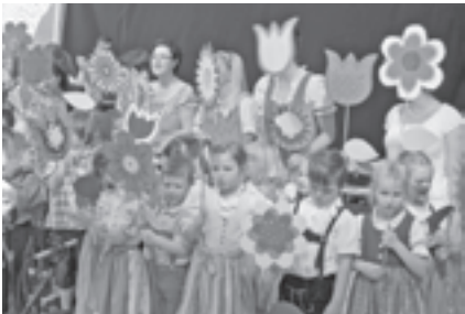
Die Kindergartenkinder sangen für das zahlreich erschienene Publikum

Am 8. und 9. Juni war es so weit, der lang erwartete Höhepunkt der Festlichkeiten zum Jubiläumsjahrgang über die Bühne. Mit zahlreichen Aktivitäten lockte Raab viele Besucher aus der Umgebung aber auch aus der Ferne herbei. Gestartet wurde am Samstag mit dem Kinderprogramm. Die Kindergartenkinder und Volksschüler haben dafür verschiedenste Lieder und Tänze einstudiert und konnten diese im vollen Festzelt zum Besten geben.