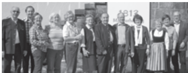
Nur durch die Hilfe der vielen aktiven Mitglieder können so viele Projekte realisiert werden

war ein gelungener, humorvoller Abend, an dem für einige Stunden der Alltagsstress ausgeschaltet werden konnte. In der Kellergröppe wurde eine neue Informationstafel angebracht, auf der alles über die biologische und historische Entstehungsgeschichte der Kellergröppe nachgelesen werden kann.