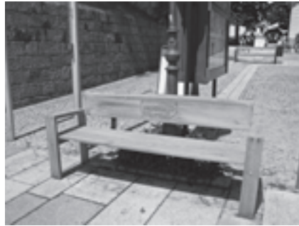
Lädt zum Verweilen ein - die neue Pramtal Sunnbeng in der Schatzlgasse

Eine Aktion des Regionalverbandes Pramtal: Jede Gemeinde in der Region Pramtal bekam eine „Pramtal Sunnbeng“ zum Aufstellen an einem gut frequentierten Ort in der jeweiligen Gemeinde. Die Bänke wurden im Frühjahr ausgeliefert und werden schon eifrig genutzt. In Raab steht die "Sunnbeng" in der Schatzlgasse.