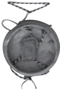
Das Marktsiegel vor ...

Das 1813 durch König Maximilian I. Joseph von Bayern verliehene Markt-recht für Raab wurde 1830 von Kaiser Franz I. von Österreich bestätigt. Die Originalurkunde dieses Vorganges ist im Gemeindeamt noch vorhanden, das dazugehörige Große Siegel des Kaisers war aber im Laufe der Zeit arg in Mitleidenschaft gezogen worden. Vom Siegelwachs blieben nur mehr wenige Fragmente übrig.